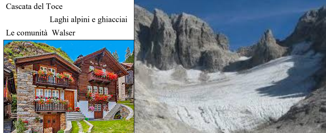
Laghi alpini e ghiacciai