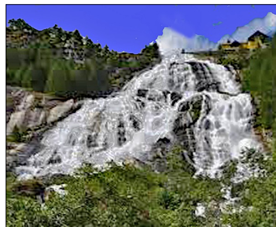
Cascata del Toce