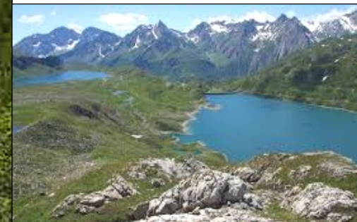
Alto Piemonte Verbano-Cusio-Ossola